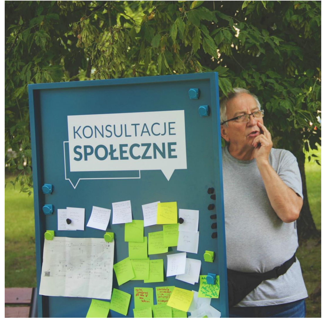
Mobilny punkt konsultacyjny – 23 czerwca