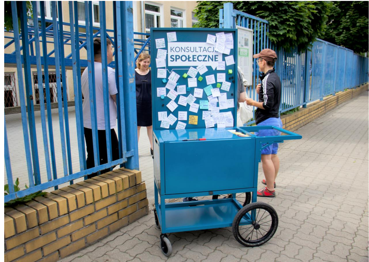
Mobilny punkt konsultacyjny – 8 czerwca

Zestawienie wszystkich opinii zebranych podczas konsultacji znajduje się w załączniku do raportu.