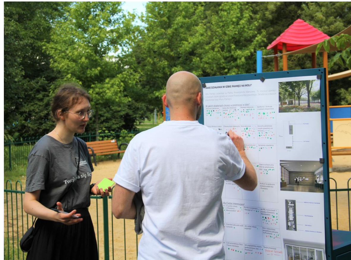
Mobilny punkt konsultacyjny – 23 czerwca

Dodatkowo korzystaliśmy z planszy przyczepionej z drugiej strony tablicy wózka. Na planszy przedstawiliśmy wizualizację Izby Pamięci oraz wstępne propozycje na działania i tematy, które mogą być podejmowane w Izbie. Chętne osoby mogły ocenić propozycje zaznaczając kropką na planszy te, które były dla nich najbardziej interesujące. Części osób łatwiej było rozmawiać odnosząc się do już istniejących propozycji.