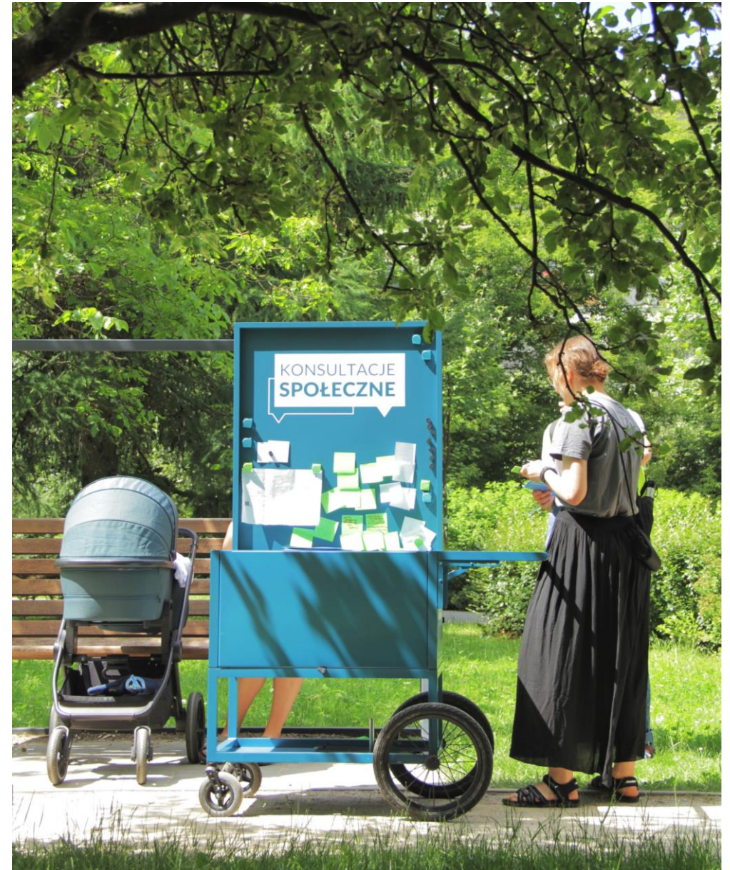
Mobilny punkt konsultacyjny – 23 czerwca

Podczas konsultacji chcieliśmy dowiedzieć się, co mieszkańcy i mieszkanki chcą, żeby działo się w Izbie Pamięci. Jakie działania przyciągną ich do tego miejsca? Jakie tematy warto poruszać w tym miejscu?