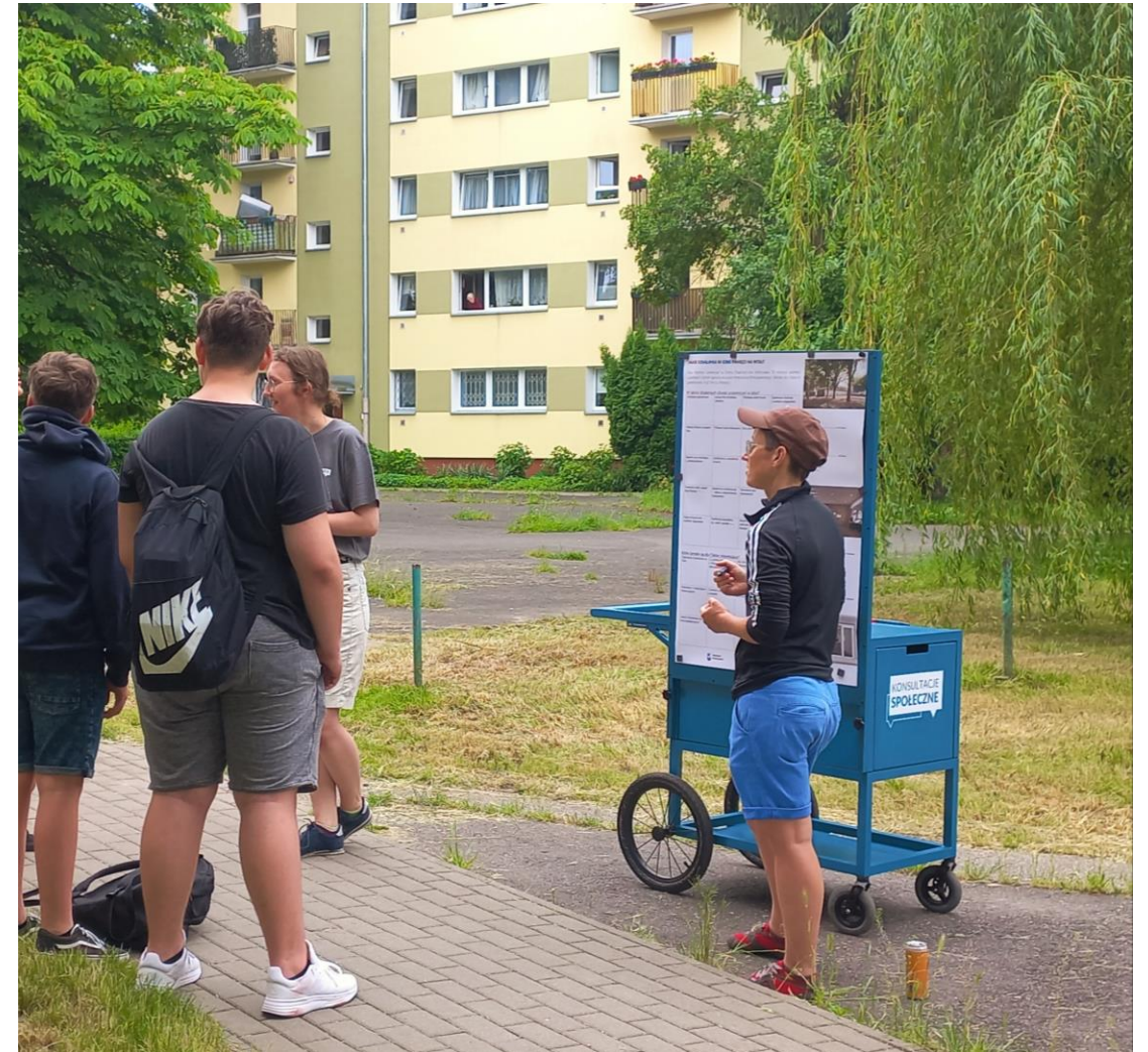
Punkt konsultacyjny – 8 czerwca

Informacje o Izbie można śledzić na jej stronie.