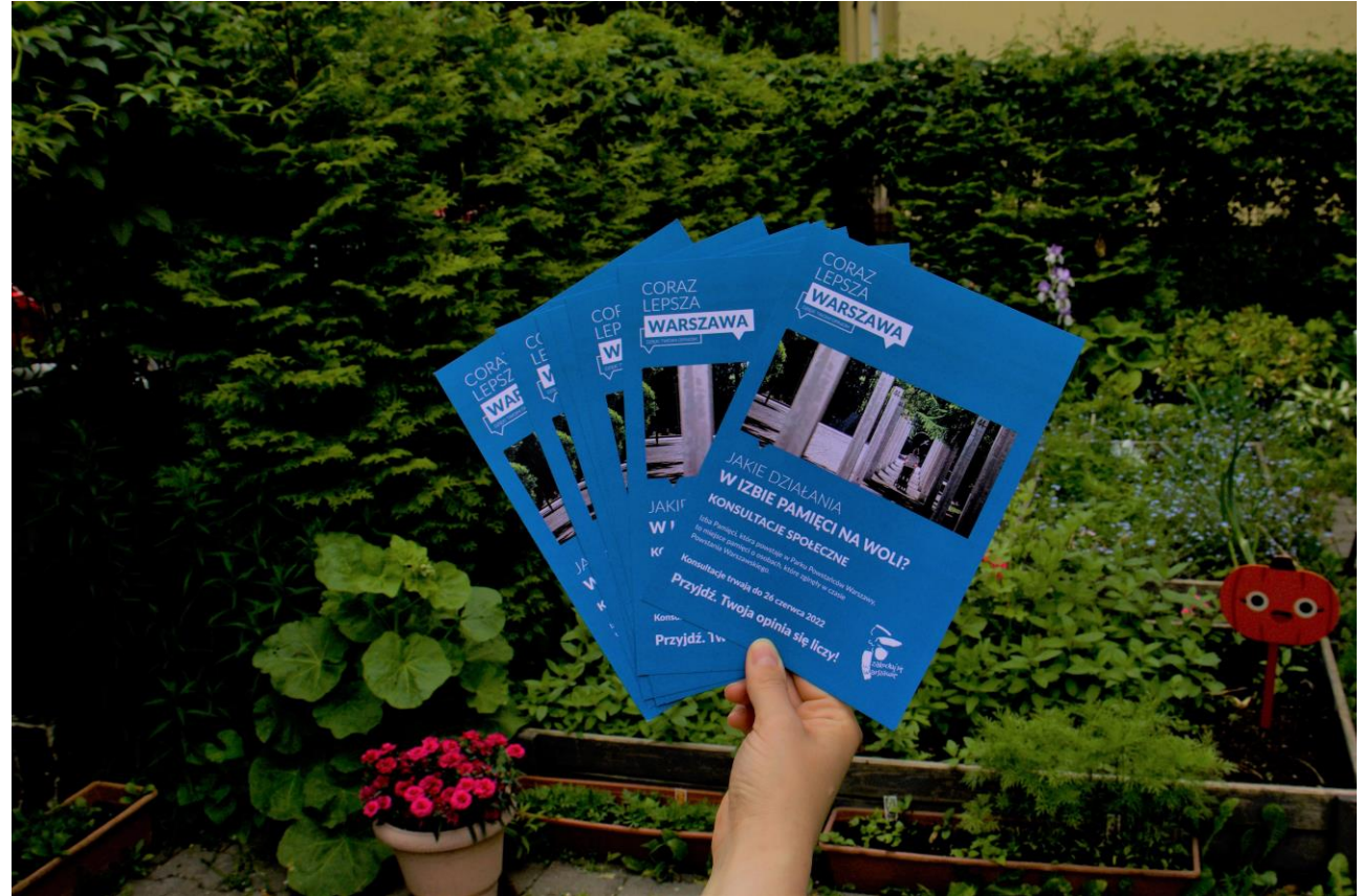
Ulotki konsultacyjne